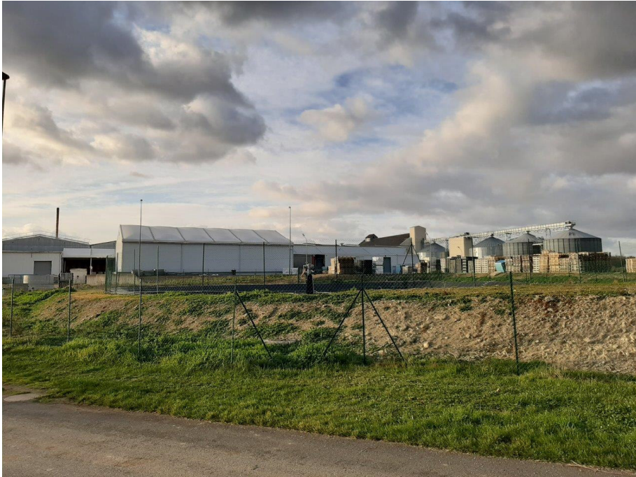
Point de vue 10 – environnement proche