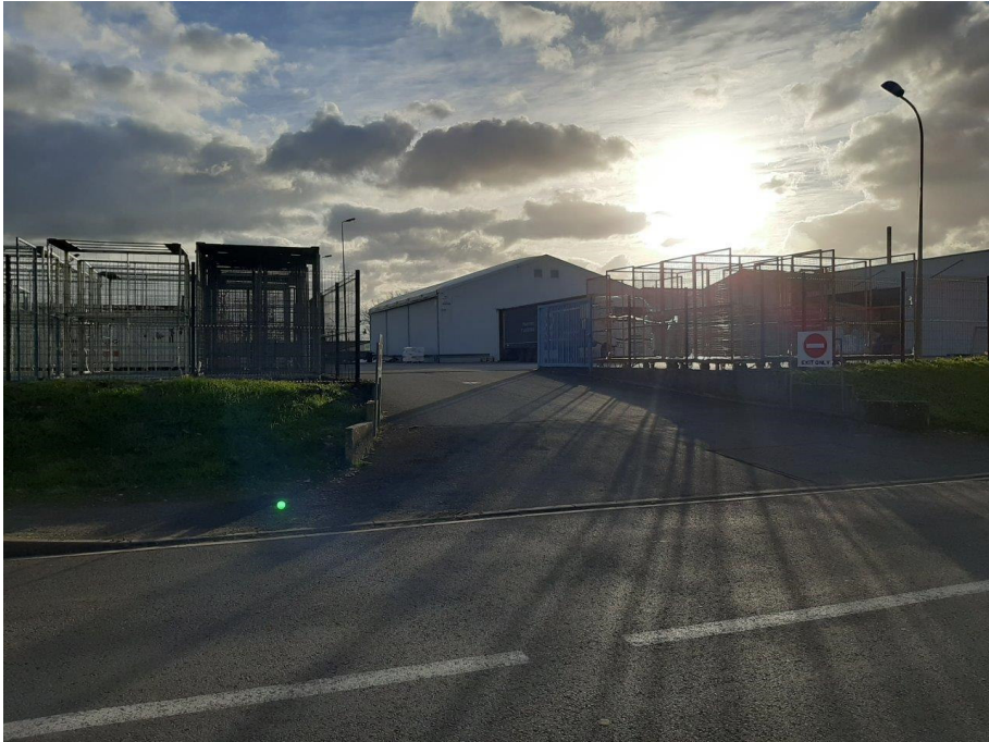
Point de vue 8 – environnement proche