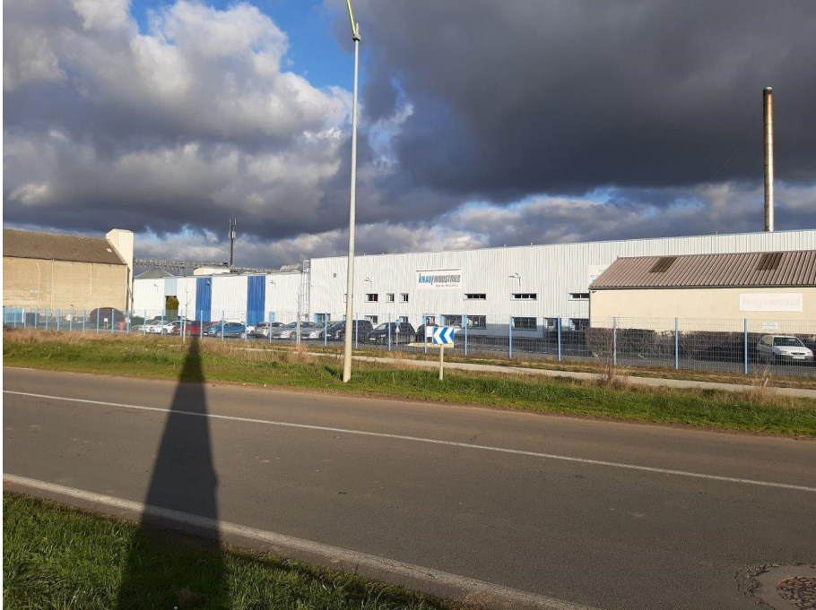
Point de vue 1 – environnement proche